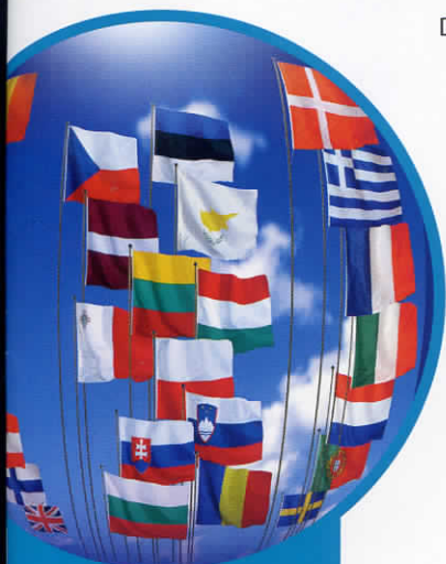
De vlaggen van de 27 leden van de EU

Nog nooit waren er in zo korte tijd zoveel landen tegelijk bij de EU gekomen. Dit is een echte „familieunie”: eindelijk zijn het oosten, het midden en het westen van Europa weer bij elkaar.